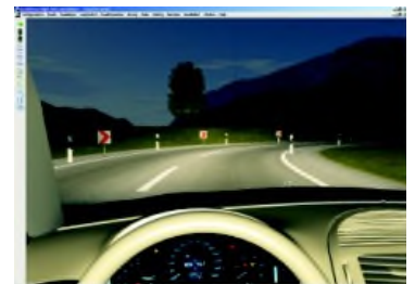
設計したヘッドランプの配光パターンを夜間ドライブシミュレーターで確認

“光の拡がりから逆に形状を導く”ことが可能なアルゴリズム (FunGeo) を搭載しているため、 想定した照明の性能からデザインを検討するという、通常とは逆のアプローチ でのものづくりが可能です。また、完成品の見た目を評価するレンダリング画像作成機能により、 試作品を作らずに見栄えの評価を行うこともできます。