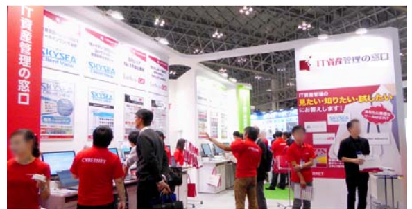
情報セキュリティ EXPO【秋】のブース

http://www.cybernet.co.jp/itsolution/seminar_event/event/ist2017_west